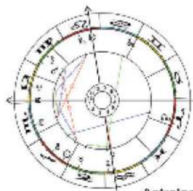
Astrologie: Horoskope Lieferung innerhalb 48 Stunden