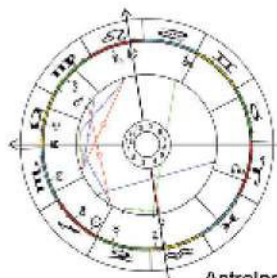
Astrologie: Horoskope Lieferung innerhalb 48 Stunden